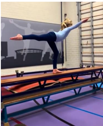
Uit de video van turnen

Geef je op door een mailtje te sturen naar m.frederik@bredeschoolovervecht.nl